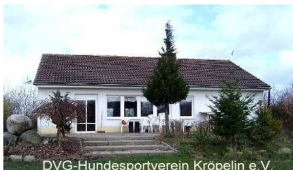
DVG-Hundesportverein Kröpelin e.V.